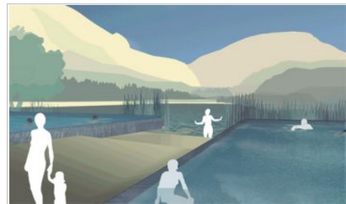
Les bassins de natation surélevés offrent une vue dégagée sur Géronde. Entre eux, des passages permettent aux nageurs d'aller piquer une tête dans le lac.

Dans un souci de maîtrise des coûts, le jury a suggéré à la Ville d'alléger le programme pour les vestiaires et le parking, et de reporter l'aménagement de trois lignes de nage sportive dans le lac. L'Exécutif a pleinement souscrit à ces propositions. Ainsi écrié, le projet respecte l'enveloppe budgétaire prévue dans la planification de la Ville (environ 6.5 millions de francs).